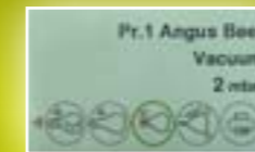
LED ekran u boji