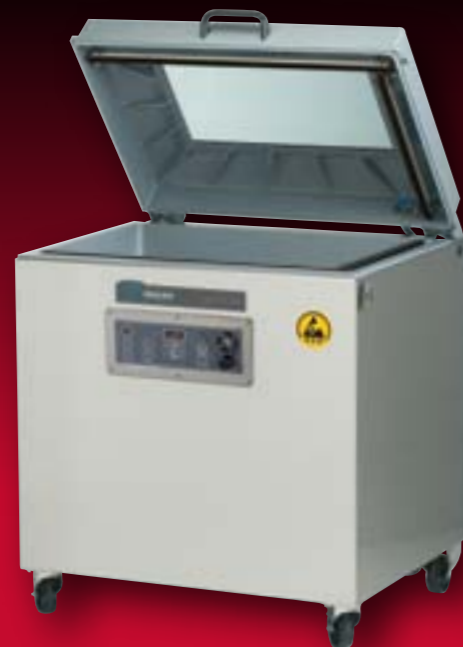
Slika: Falcon 80 ESD konfiguracija